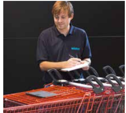
WARTUNGSVERTRÄGE – garantieren technisch einwandfreie und optisch ansprechende Einkaufswagen.