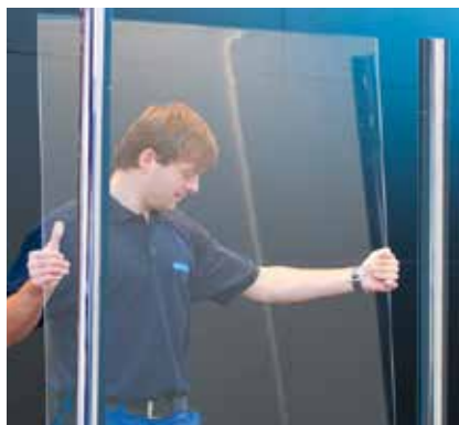
DIE INSTALLATION UND INBETRIEBNAHME der Wanzl Qualitätsprodukte erfolgt ausschließlich durch qualifiziertes Fachpersonal.