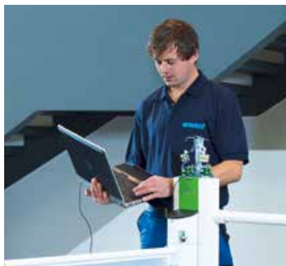
MIT REGELMÄSSIGEN CHECKS UND PRÜFUNGEN sorgt Wanzl für perfekt funktionierende Produkte.