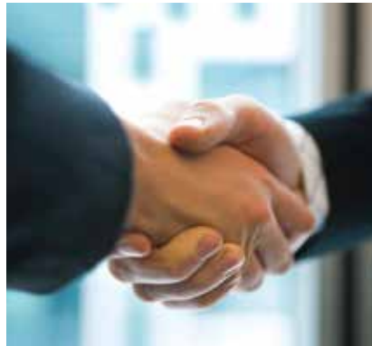
KOMPLETTVERTRÄGE – individuelle Komplettlösungen nach Wunsch.