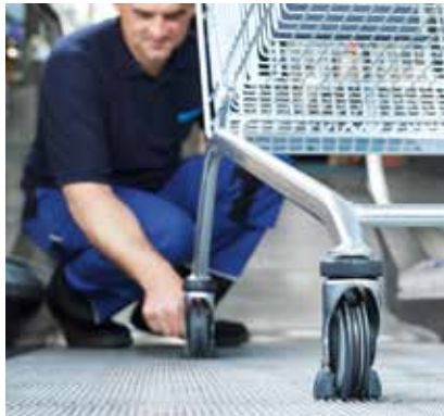
WANZL BEUGT PROBLEMEN VOR , beseitigt Mängel und hält den reibungslosen Betrieb am Laufen.