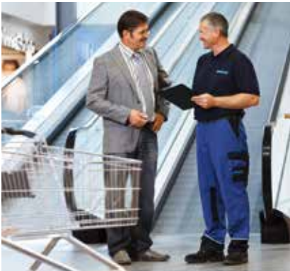
WANZL BERÄT SIE GERNE VOR ORT , um die Umgebungssituation bei der Auswahl des für Sie geeigneten Systems zu berücksichtigen.