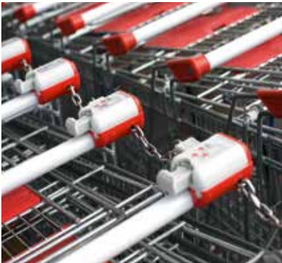
TOTAL TROLLEY MANAGEMENT – effizientes und nachhaltiges Management für große Einkaufswagenflotten.