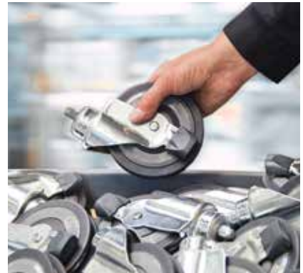
ORIGINAL-ERSATZTEILE von Wanzl gewährleisten höchste Sicherheit, optimale Funktion und lange Lebensdauer.