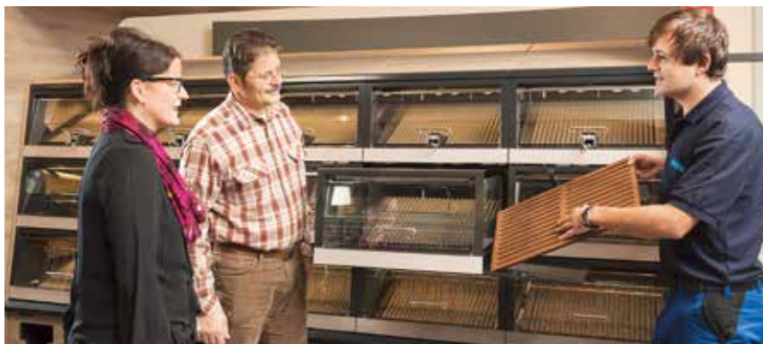
AUCH NACH ERFOLGREICHER INSTALLATION ist Wanzl für Sie da. Mit fach- und praxisgerechten Einweisungen ist Ihr Personal schnell in der Lage, unsere Produkte effizient und richtig einzusetzen.