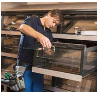
STÖRUNGEN WERDEN DURCH WANZL-SERVICE schnell und unkompliziert behoben.