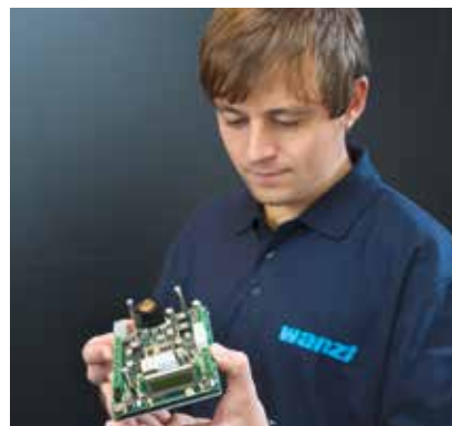
MIT WANZL ORIGINAL-ERSATZTEILEN ist die Funktionalität Ihrer Leit- und Warenpräsentationssysteme dauerhaft sichergestellt.