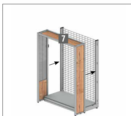
Montar la estructura superior del extremo de la góndola sin marco publicitario