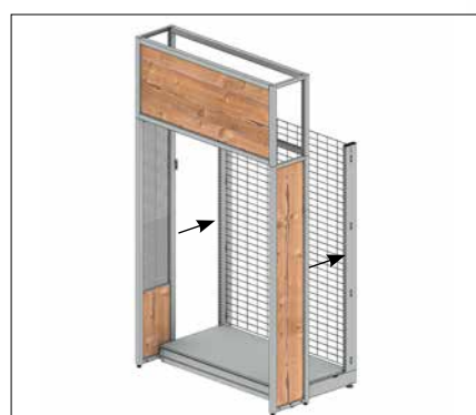
Montar la estructura superior del extremo de la góndola con marco publicitario