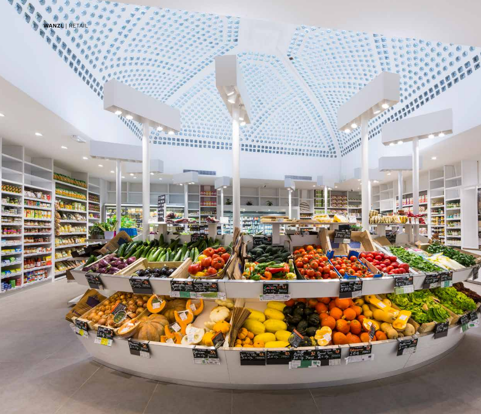
↑ OBST- UND GEMÜSESTAND IM DADA, BIOCOOP PARIS: Früchte in Hülle und Fülle ausgebreitet