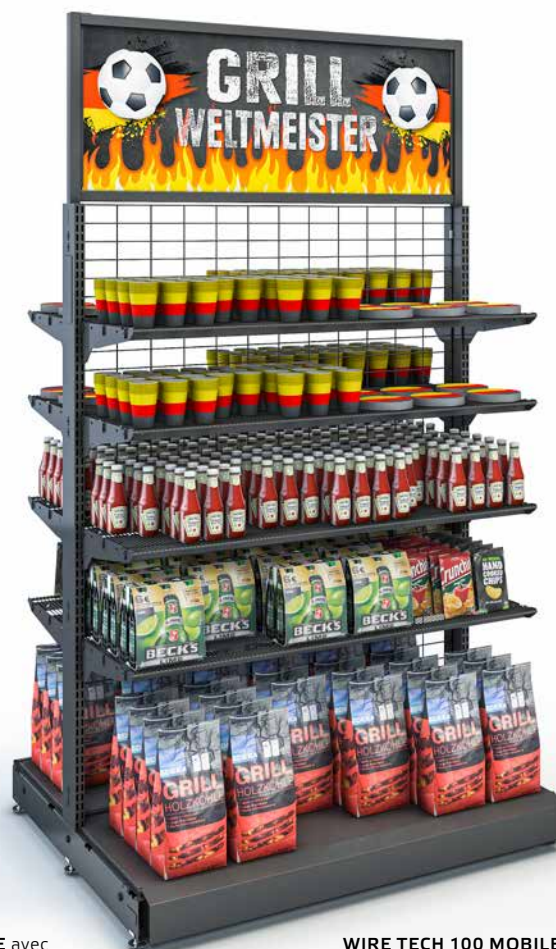
WIRE TECH 100 MOBILE avec tablettes fil et encart pour publicité