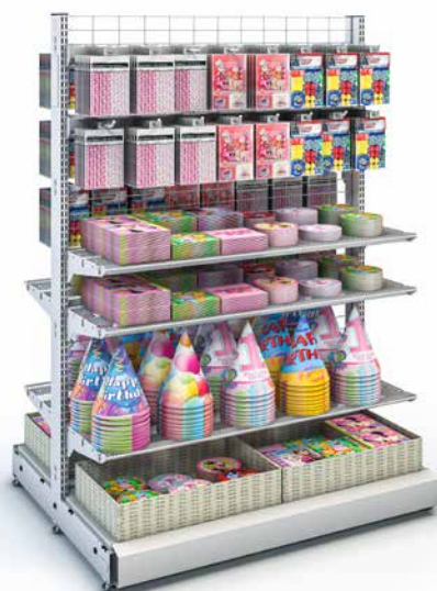
WIRE TECH 100 MOBILE avec tablettes fil et crochets pour blisters

■ Avec le système de présentation wire tech 100 mobile , vous proposez une mise en scène toujours attrayante des différents univers de produits et des articles saisonniers. L'encart pour publicité permet d'accrocher de grandes pancartes, intensifie la perception et active les clients. Les tablettes fil de Wanzl attirent le regard des clients sur l'essentiel : votre offre de produits.