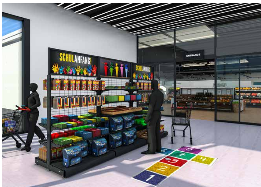
CHANGER RÉGULIÈREMENT LA POSITION du système de vente permet de réinventer la présentation et de donner un nouvel élan.