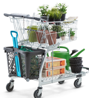
FLEXCART con supporto per cestino GT40 eco