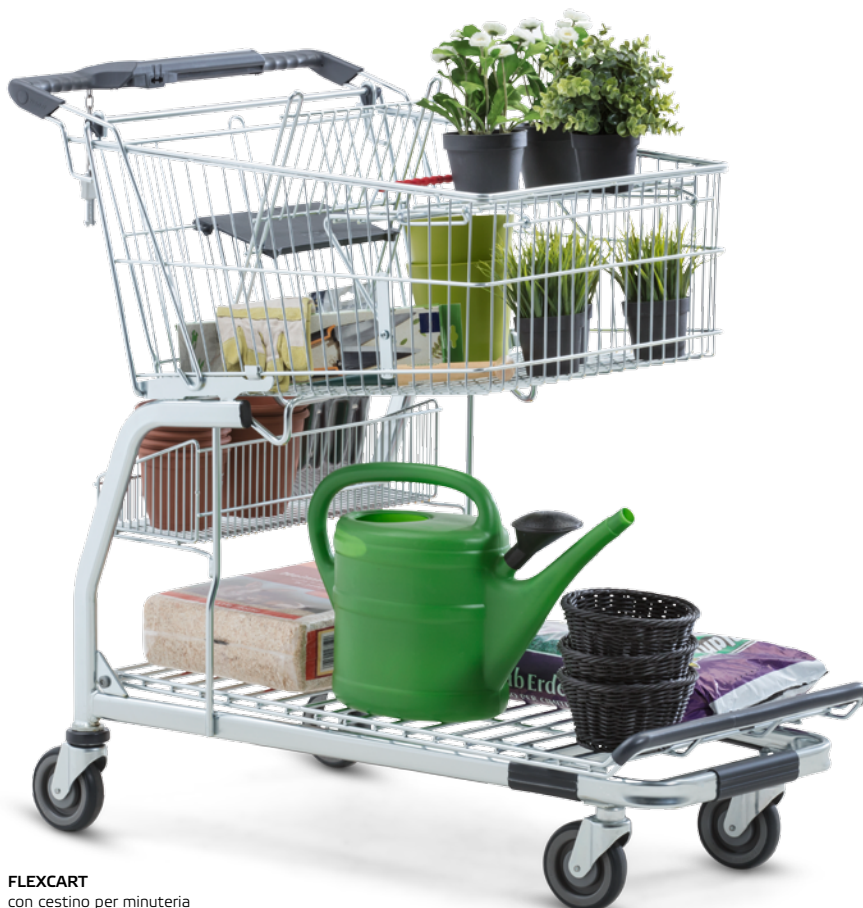
FLEXCART con cestino per minuteria