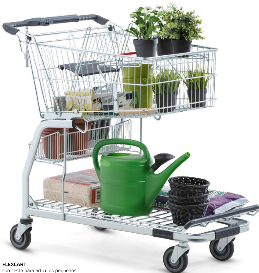
FLEXCART con cesta para artículos pequeños