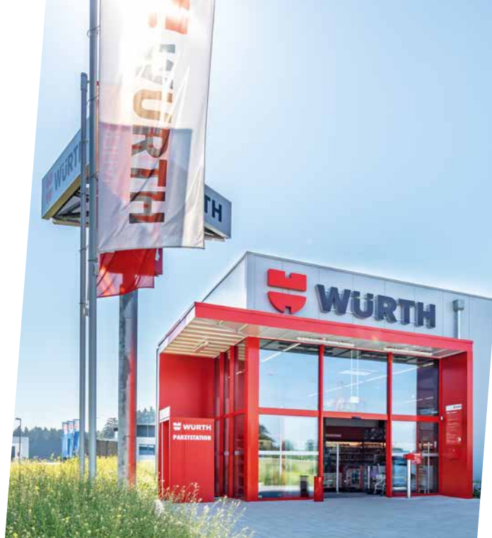
← MERCADO WÜRTH con «autoservicio integral»: equipado por Wanzl