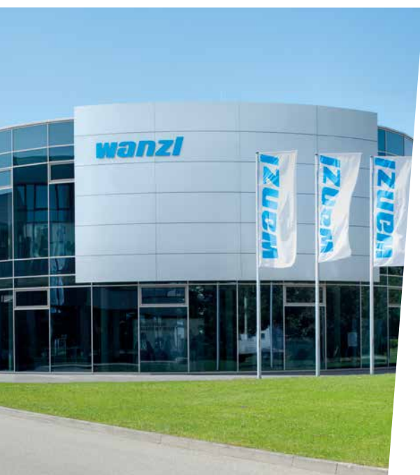
↑ SEDE CENTRALE DI WANZL a Leipheim, in Baviera: una gamma di prodotti e servizi impareggiabile nel settore retail.