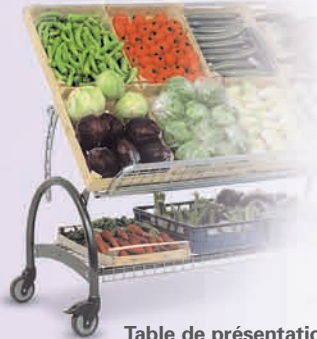
Table de présentation à grille inclinable Swing Une unité de vente maniable pour une offre attrayante.