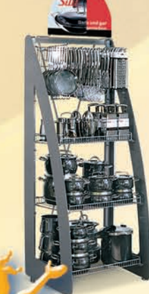
AD 100 « Joy »