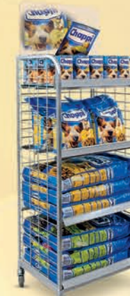
AD 300 R