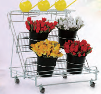
Vario virágdisplay Mobil forgalomhordozó a vágott virágok és kellékanyagok számára.