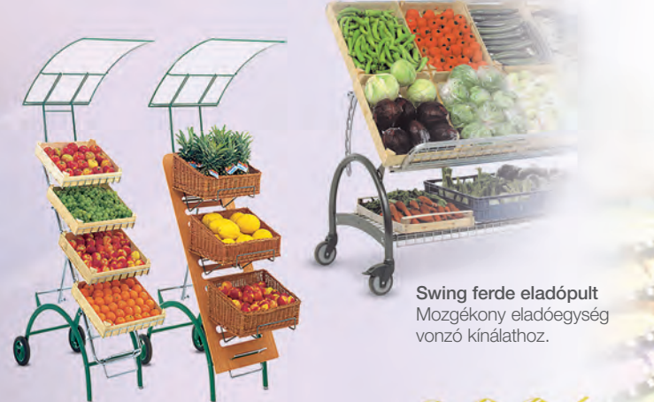
Swing ferde eladópujt Mozgékony eladóegység vonzó kínálathoz.