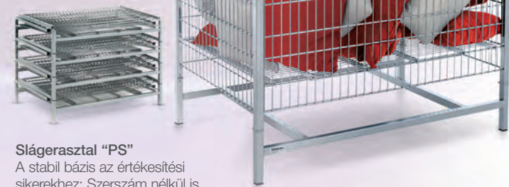
Slágerasztal "PS" A stabil bázis az értékesítési sikerekhez: Szerszám nélkül is villámgyorsan szerelhető.