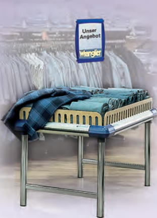
Plaza asztalrendszer Asztali programunk topmodellje: Nagy értékű anyag a nagy értékű áru számára.