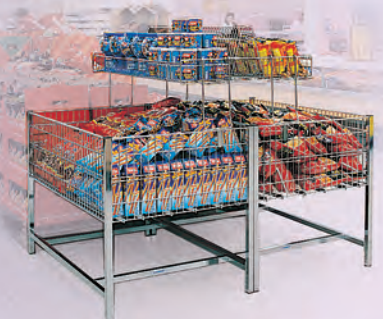
Asztali feltétek Messziről észrevehető kiegészítő kínálási felület.