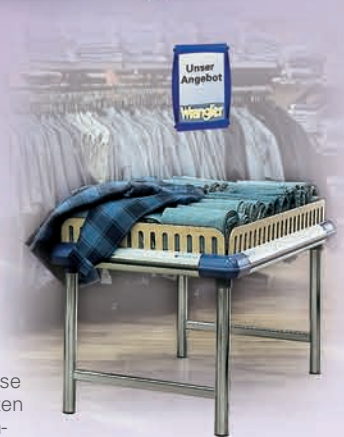
Verkooptafel Plaza De topmodellen van ons tafelprogramma: hoogwaardig materiaal voor hoogwaardige producten.