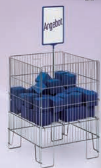
Stortmanden Geschikt voor diverse productassortimenten en productpresentaties, verkrijgbaar in mandvolume 120, 180 of 320 liter.