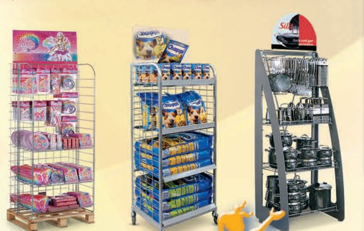
Actiedisplays Verkoopbevorderende display die tevens snel en eenvoudig te monteren is.