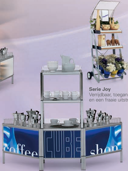
Serie Joy Verrijdbaar, toegankelijk en een fraaie uitstraling.