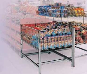
Tafelopzetstukken Extra winkeloppervlakte voor uw aanbod met afstandswerking.