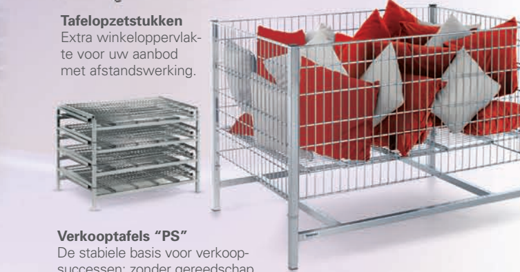
Verkooptafels "PS" De stabiele basis voor verkoop-successen: zonder gereedschap vliegensvlug gemonteerd.