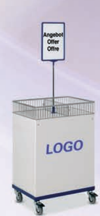
Actietafels Compact en verrijdbaar. Op verzoek met individuele belettering.