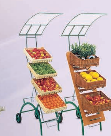
Verkoopstandaard "Swing" Verkoopbevorderende klassieker voor het groenten- en fruitaanbod.