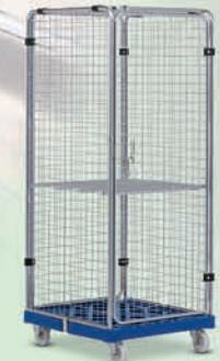
Combitainer 4 zijden gesloten, diefstalveilig afsluitbaar.