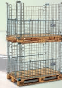
Palleteopzetten Stabiele constructie, veilig stapelbaar.