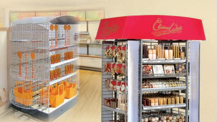
Palletwinkel Verkoopbevorderende systemen, perfect afgestemd op de palletmaat 1200 x 800 mm.

Gebonden aan tijd noch plaats. Als handelspartner kent Wanzl de dagelijkse eisen van het verkooppersoneel en ontwikkelde inklapbare en ruimtebesparende actiedisplays voor succesvolle productpresentaties.