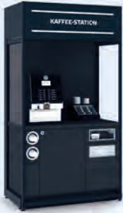
KAFFEESTATION 1250x600x2400 excl. Kaffeemaschine Art.-Nr. 37.59778.95-0001