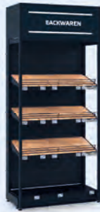
BACKWARENAUSLAGE 1000x400x2400 mit 3 Holzetagen Art.-Nr. 04.16386.95-0001