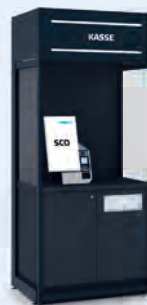
SCO MODUL WIRE TECH 100 1000x600x2400, inkl. Überbau Art.-Nr. 37.59779.95-0001 SCO Kassenterminal Art.-Nr. 98.78957.00-0000