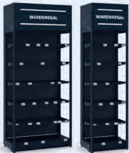
WARENREGAL mit 5 Drahtetagen inkl. Überbau 1000x400x2400 Art.-Nr. 04.16389.95-0001 625x400x2400 Art.-Nr. 04.16388.95-0001