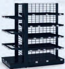
VERKAUFGONDEL + GONDELKOPF 1000x400x1600 mit 4 jew. Drahtetagen Art.-Nr. 04.16380.95-7097