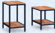
YOURTABLE T.02 665x465x550 Art.-Nr. 04.16382.95-7097 665x465x750 Art.-Nr. 04.16383.95-7097