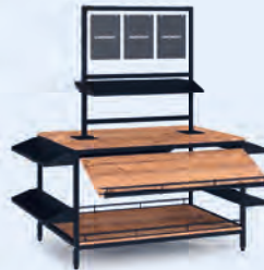
YOURTABLE T.01 mit Werbetafel für Aufsatz 1265x865x750 Art.-Nr. 04.16381.95-7097