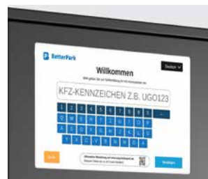
CAISSE AUTOMATIQUE V17

L'écran tactile intégré et les composants positionnés de façon ergonomique garantissent une utilisation simple et intuitive.